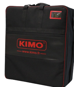
Valise de transport