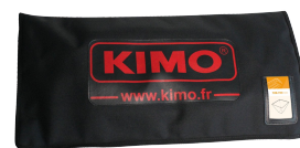
Sacoche de hotte